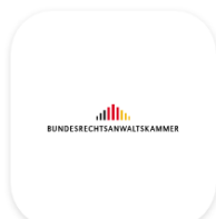
Bundesweites Amtliches Anwaltsverzeichnis