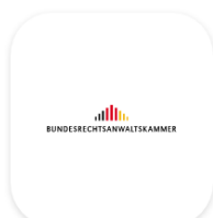
Bundesweites Amtliches Anwaltsverzeichnis